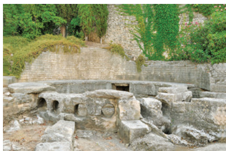
Castellum situé dans l'actuelle rue de la Lampèze à Nîmes